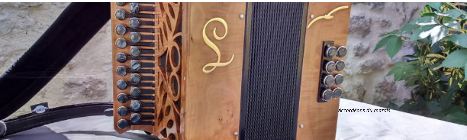
Accordéons du marais

tierces sur les basses et pas sur les accords ou l'inverse. Les systèmes pour les modifier peuvent être dessus la caisse ou au dessus de la rangée des basses, actionnables par la main gauche pendant le jeu.